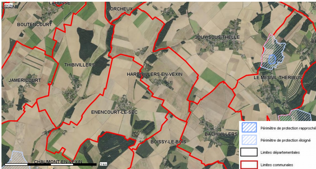
Carte publiée par l'application CARTELIE © Ministère de la Transition Écologique et Solidaire CP21 (DOM/ETER)